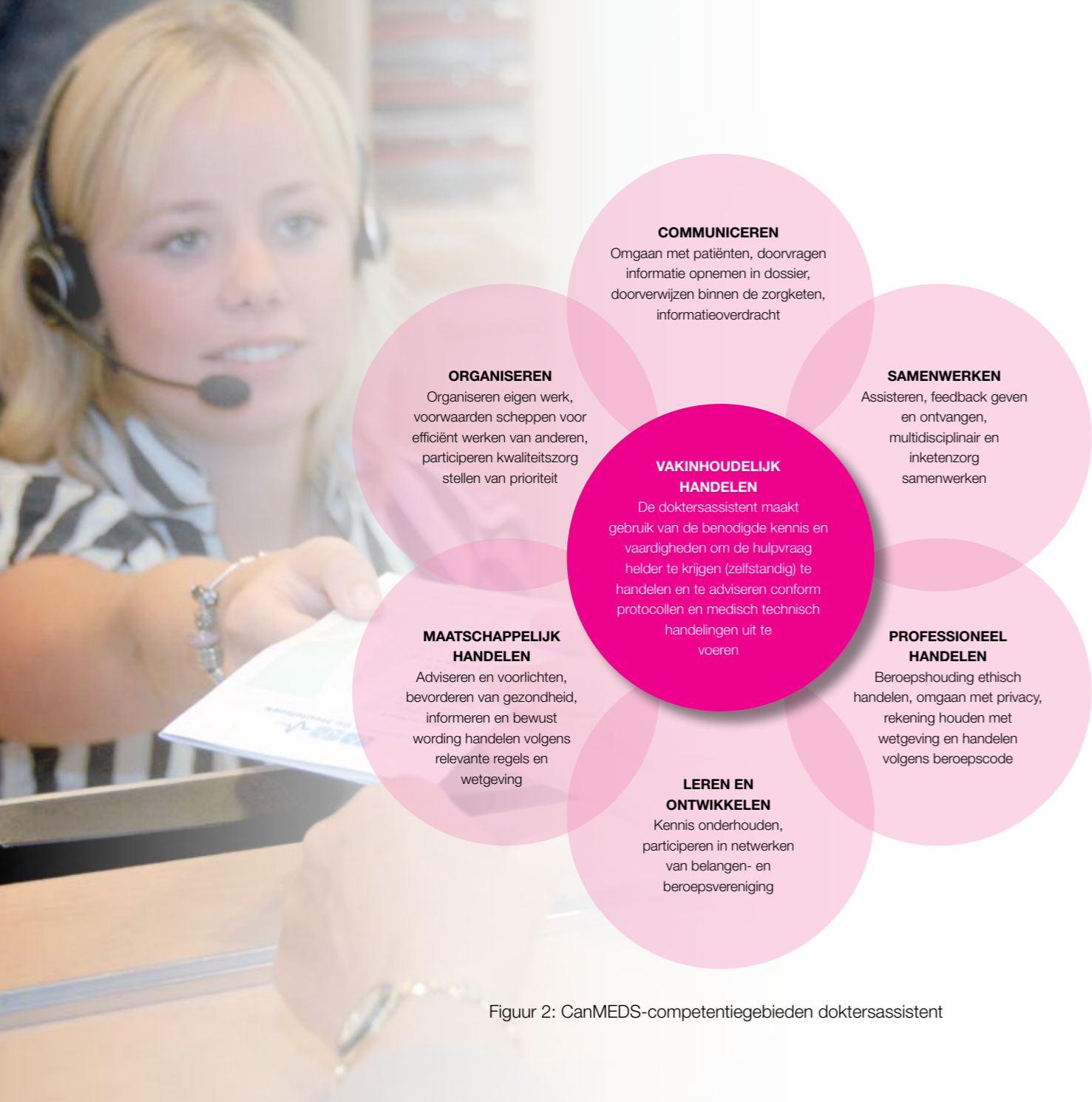
Figuur 2: CanMEDS-competentiegebieden doktersassistent

Haar vakinhoudelijk handelen wordt gekarakteriseerd door een professionele, actuele, ethische en efficiënte aanpak alsmede door effectieve communicatie met de patiënt en andere betrokkenen bij het zorgverleningstraject. Ze is mede verantwoordelijk voor de resultaten van het team en de organisatie.